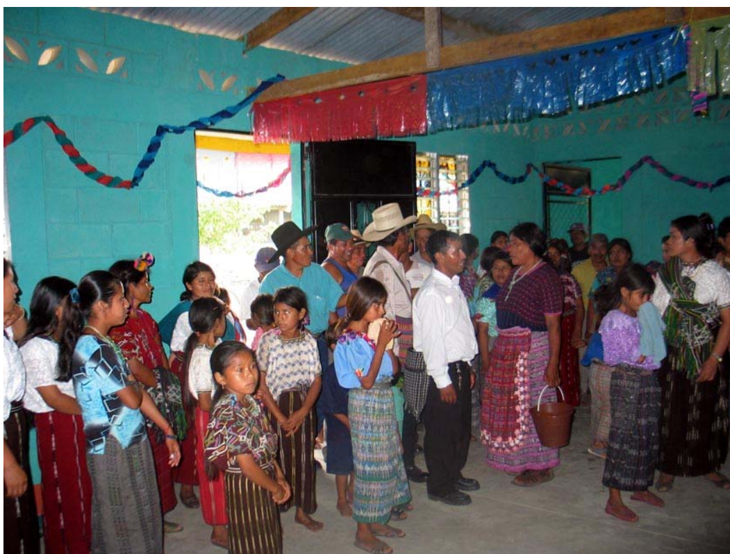
Figura 2. Población indígena inaugurando el Aula CIPAGUATE 1