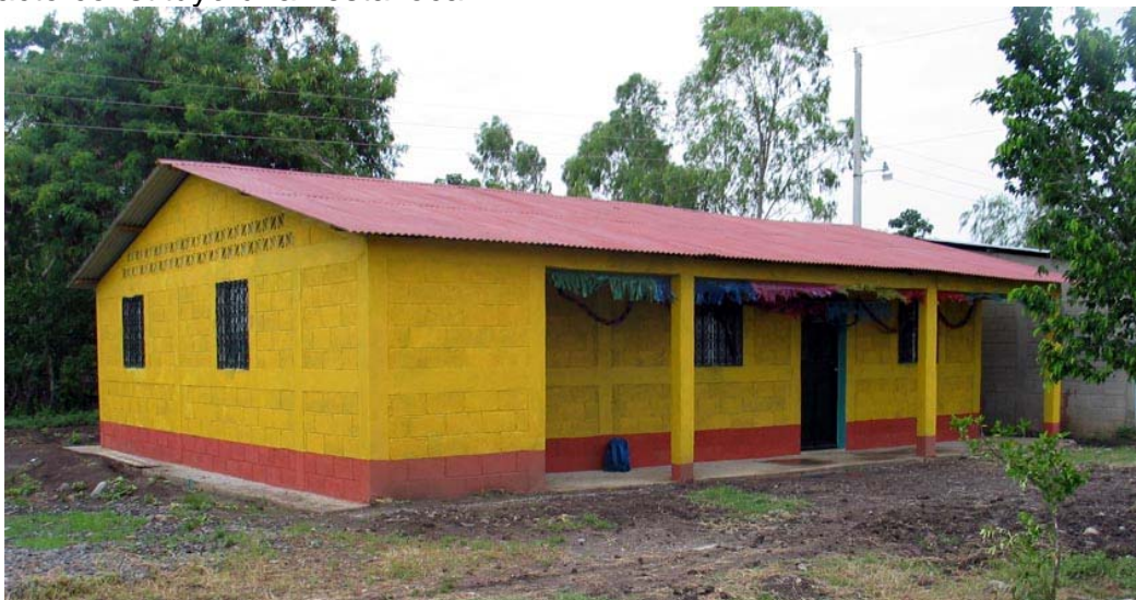
Figura 1. Aula CIPAGUATE1 de El Triunfo (Retalhuleu). Inaugurada en Agosto 2006

reuniones (al menos 3 por curso). El fracaso escolar de los niños becados es mínimo: sólo 2 de ellos han abandonado los estudios iniciados. También hemos construido la primera de – esperamos – una serie de Aulas – Biblioteca Polivalentes ; esta primera, el aula CIPAGUATE1, de unos 100 m 2 , en la localidad de El Triunfo, en el Departamento de Retalhuleu. Incluye una estancia para profesores cooperantes y, además de Biblioteca, servirá como aula de informática y local para impartir todo tipo de cursos de formación. Nosotros financiamos los materiales, las autoridades locales decidieron la ubicación y cedieron el terreno, y los propios indígenas aportaron gratuitamente la mano de obra para su construcción. Fue inaugurada en Agosto de 2006 y el acto constituyó una fiesta local.